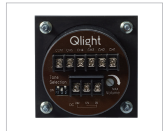
전원 및 음색 결선용 단자대(후면)

※ 내장음 최대 음량은 WS-Ch1 / WM-Ch4 / WA-Ch4 기준입니다.