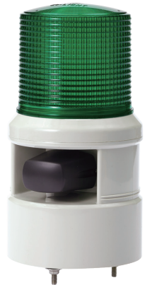
S100DL / S100DS