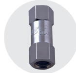
NON RETURN 밸브