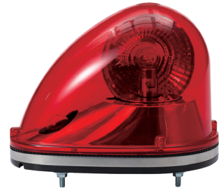
SK / SKH