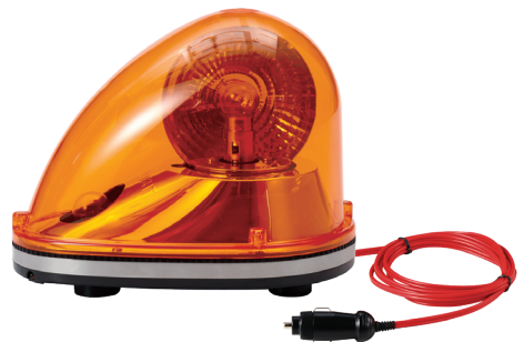
SKM / SKMH